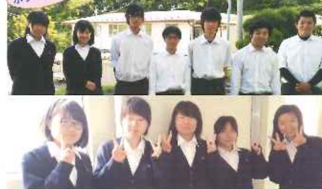
地球清掃や花植え・畑にサツマイモの苗植えを行いました。