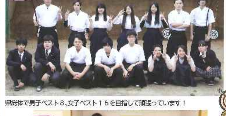
県総体で男子ベスト8、女子ベスト16を目指して頑張っています！