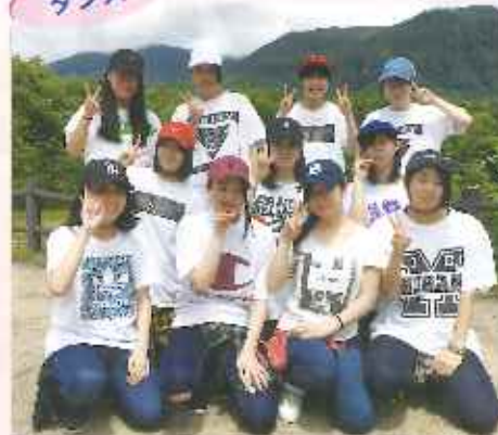
今年もダンスの楽しさをみんなに伝えていきます。