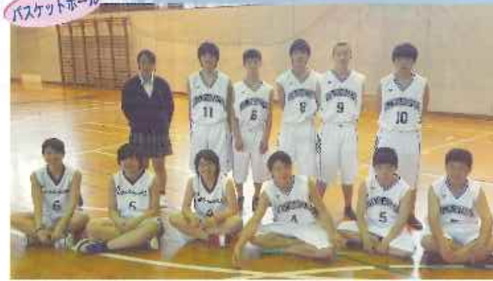
全力で頑張ります。