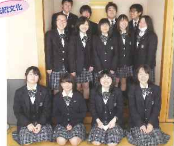
今年は甲冑作りにも挑戦し、政宗公まつりに参加します！