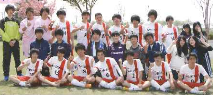
みんな元気がよく明るい人たちがいっぱいです。