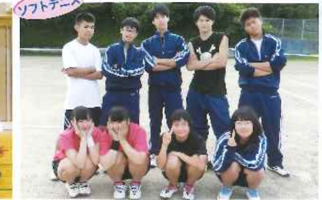
技術の面も気持ちの面も向上できるように頑張っています！