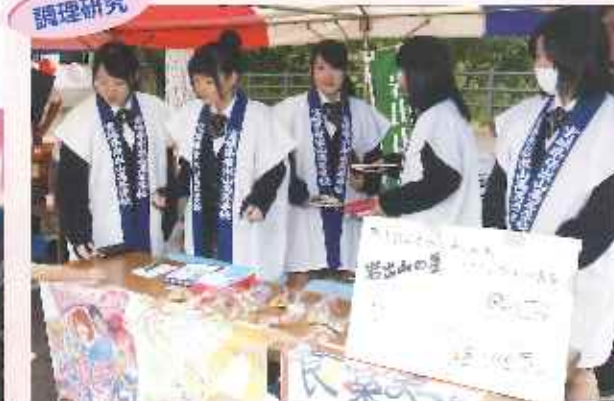
毎年食祭まつりに参加したり、毎週水曜日に校内で活動しています。