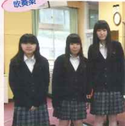
自由に楽しく練習しています！もちろん演奏も！