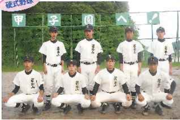
全力プレーを合言葉に頑張っています！