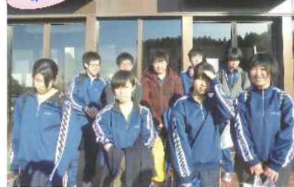
県大会出場を目指し、日々技術の向上に努めています。