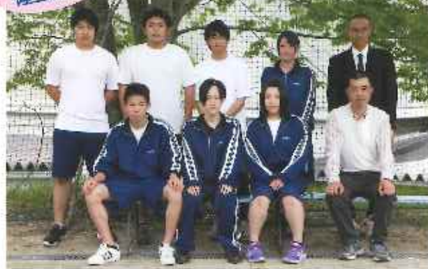
おしゃべり のち 練習 とときどき サボリ