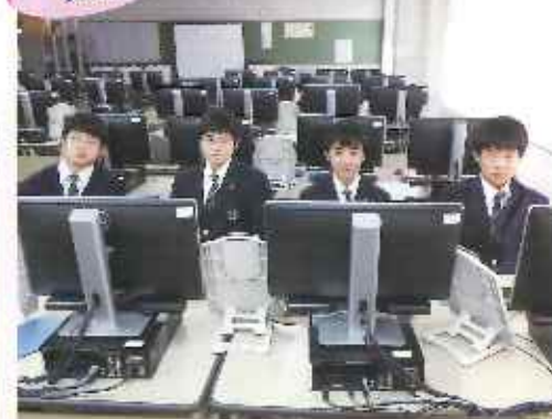
ワープロ検定などの取得に向けて日々頑張っています。