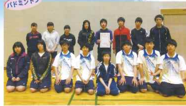
全員初心者からですが、優勝をめざし頑張ります。