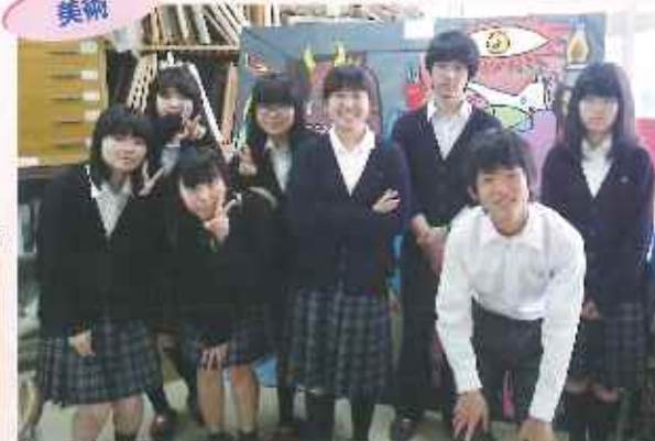
受賞を目標に個性豊かなメンバーとともに頑張っています！