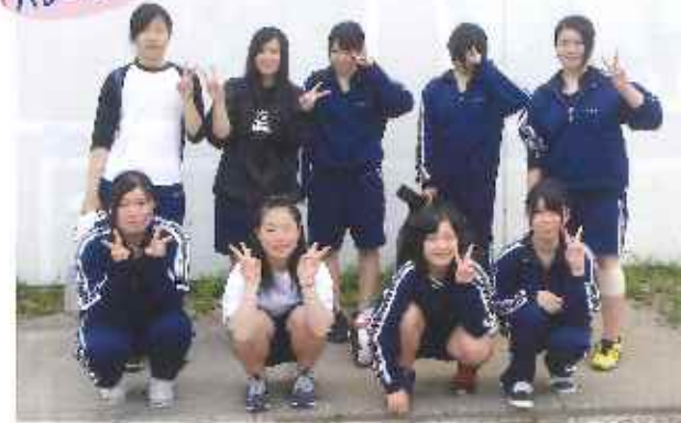
大会で1つでも多く勝てるように頑張ります！