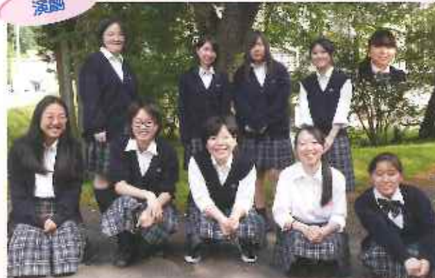
オリジナル脚本での県大会出場を目標に日々稽古を重ねています！