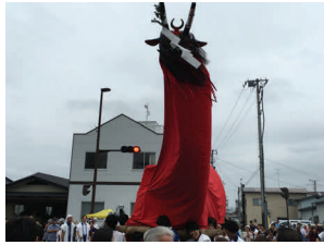
9/11 政宗公まつり（牛鬼）