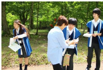
〈生徒会 プログラム配布〉