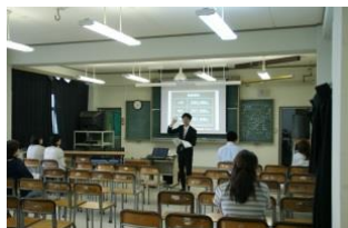
〈就学支援について〉