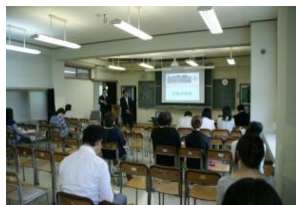
〈進路現状について〉

6月25日（土）午前中 PTA 地区懇談会、午後から PTA 保護者進路説明会が行われました。大阪・東京から就職、進学そして就学支援に関するスペシャリストが5名来校し大変参考になるお話をいただきました。PTA 地区懇談会では各地区ごとに、学校の話や保護者から学校に対しての質疑応答、情報交換が活明会が行われ3年様に参加していただきました。お忙しい中ありがとうございました。