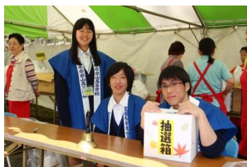
〈生徒会 抽選会場手伝い〉